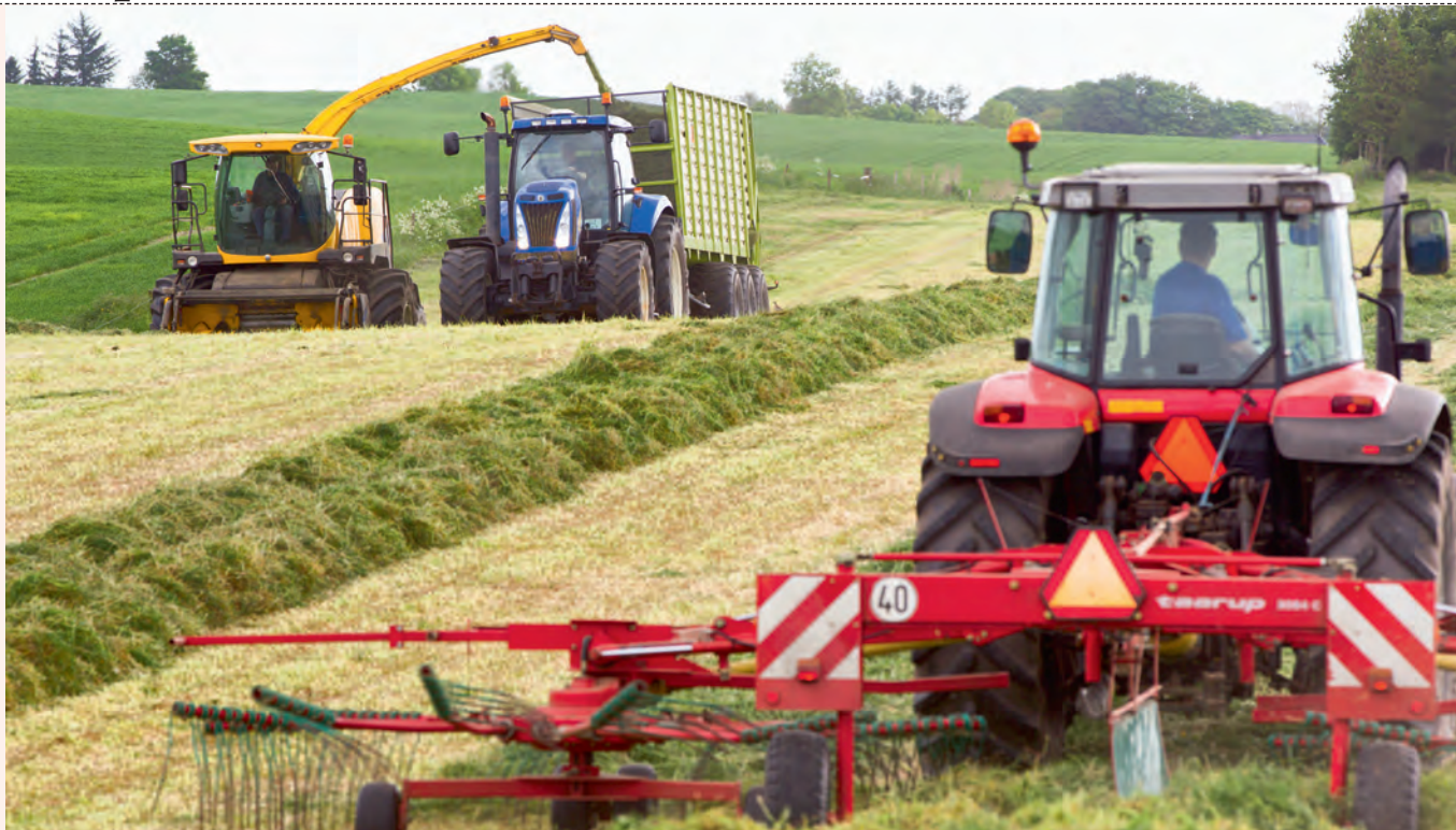
Omkostningerne til marken drives i høj grad af bedriftens arrondering. Det kan jeg ikke ændre, vil nogle sige. Jo - er svaret. Tag en snak med naboerne. Måske kan arrondering forbedres ved at bortforpagte den jord, som ligger længst væk, og forpagte noget, som er tættere på.